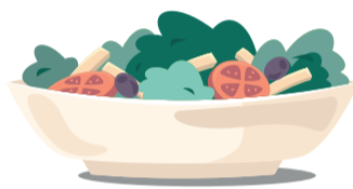
Olej ze salátu