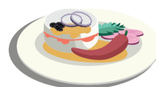
Olej z nakládaných potravin